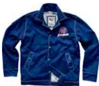
CORTAVIENTOS RESISTENTE AL AGUA, ES DE NAILON Y LLEVA SERIGRAFÍA DEL CAMPEONATO DE 1948. 130 €