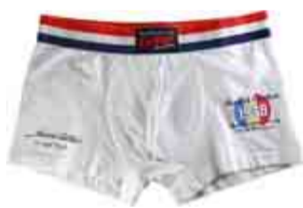
CALZONCILLO BOXER DE ALGODÓN. TAMBIÉN EN BLANCO Y AZUL MARINO. SALLEN A LA VENTA ESTE VERANO.