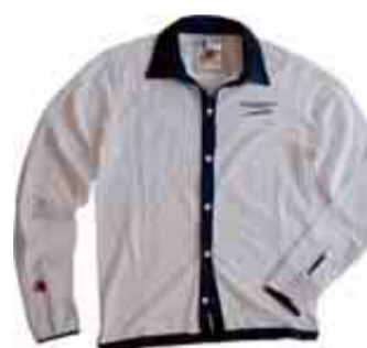
CAMISA DE PIQUÉ (ALGODÓN 100%) CON LA FIRMA DEL BOXEADOR EN ROJO. 90 €