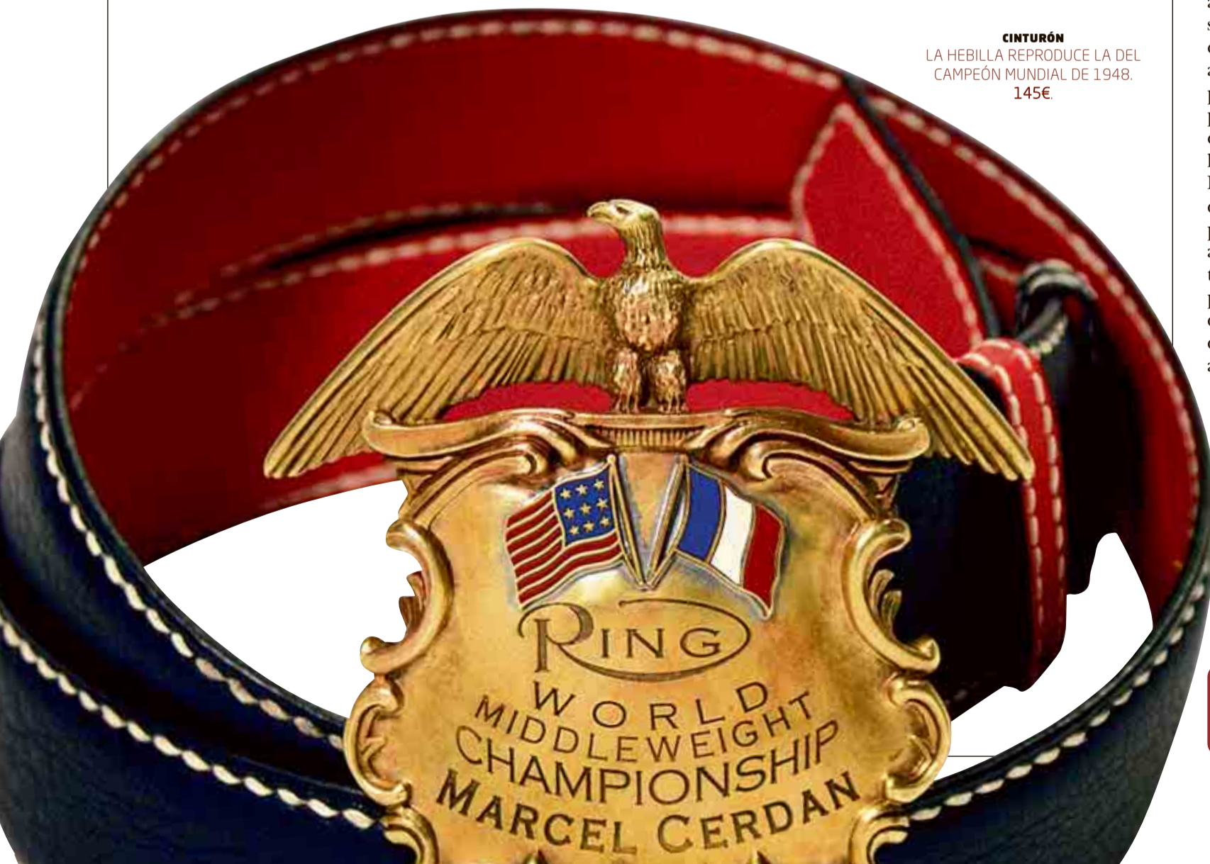
CINTURÓN LA HEBILLA REPRODUCE LA DEL CAMPEÓN MUNDIAL DE 1948. 145€