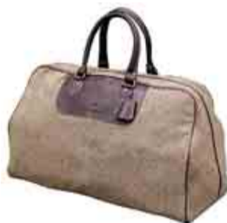
BOLSA DE VIAJE REALIZADA EN CUERO Y TWEED. MIDE 58 X 28 X 39 CM Y PESA 1 KG. 450 €